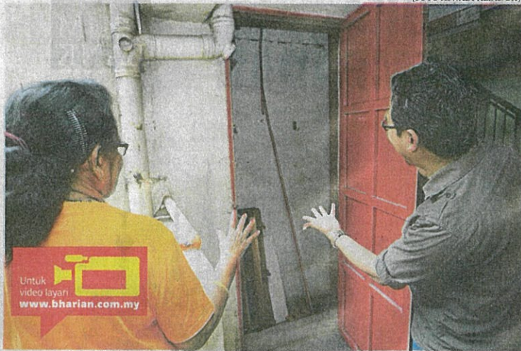
Seorang penduduk (kiri) menunjukkan ketiadaan alat pemadam api di tingkat 13 Perumahan Awam Seri Kelantan, Sentul.

bahaya dikeluarkan kepada 47 flet, pangsapuri dan kondominium seluruh nega