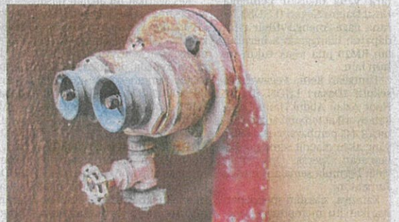
Keadaan sistem pancur basah atau alat pemadam api mudah alih di Pangsapuri Pantai Indah Fasa 1, Pantai Dalam.