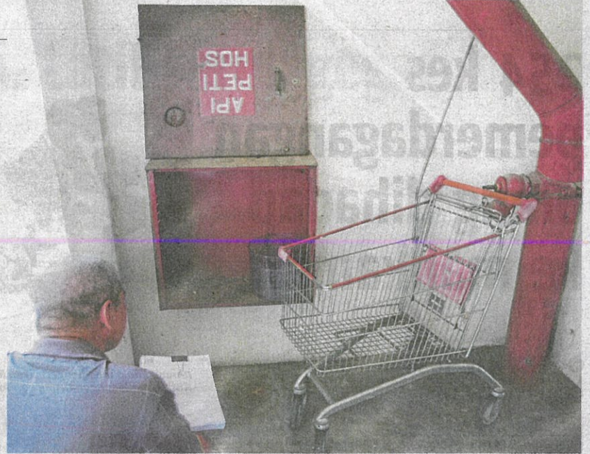
Wakil penduduk meninjau keadaan sistem pancur basah atau alat pemadam api mudah alih yang tidak sempurna di Pangsapuri Pantai Indah Fasa 1 di Pantai Dalam, sekalipun notis bahaya kebakaran dikeluarkan Jun lalu.

"Notis ini menimbulkan persoalan kerana ia diluluskan dulu antara pihak pemaju dengan bomba. Kita terima notis ini dan akan laksanakan secara berperingkat," katanya merujuk kepada kemampuan kewangan pengurusan pangsapuri yang terhad.