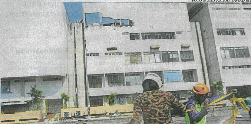
Anggota Balai Bomba dan Penyelamat Kuantan melakukan pemeriksaan dan pembersihan di tempat kejadian selepas tangki air pecah dari tingkat 4 di Kompleks Teruntum, Kuantan semalam.