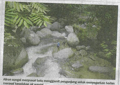
Aliran sungai menyusuri batu menggamit pengunjung untuk menyegarkan badan merasai kesejukan air sungai.