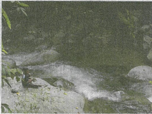
Pengunjung juga boleh melakukan aktiviti memancing di sepanjang sungai.

"Kebiasaan untuk menikmati keindahan suasana sungai sebegini, kita kena jalan kaki jauh masuk ke dalam hutan. Amat sesuai untuk