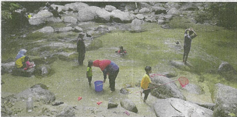
Terdapat kawasan yang cetek dan sesuai untuk riadah bersama keluarga.

Hakimi berkata, kemudahan di taman pertanian juga perlu diperbaiki selain menaik taraf kawasan pusat rekreasi itu.