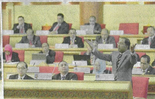
Zambry ketika membahas tentang penarikan peruntukan dalam Mesyuarat Kedua Penggal Kelima, Dewan Negeri Yang Ketiga Belas Perak Darul Ridzuan, semalam.