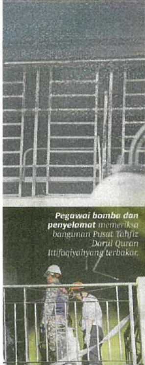
Pegawai bomba dan penyelamat memeriksa bangunan Pusat Tahfiz Darul Quran Ittifaqiyah yang terbakar.