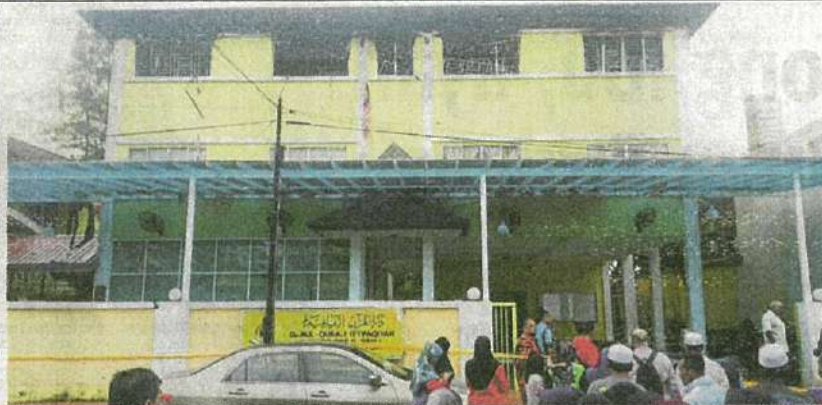
Ahli keluarga dan waris berkumpul di tempat kebakaran sementara menunggu mangsa yang rentung dikeluarkan dari bangunan.