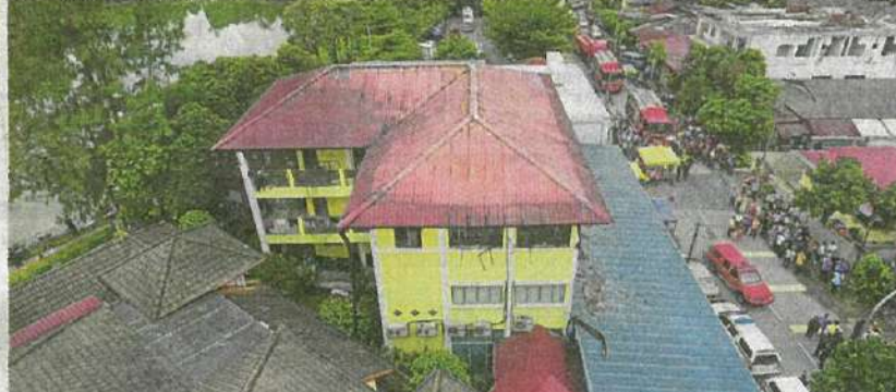
Keadaan kawasan kebakaran Pusat Tahfiz Darul Quran Ittifaqiyah (bangunan bercat kuning) di Jalan Keramat Ujung, Kuala Lumpur, semalam.