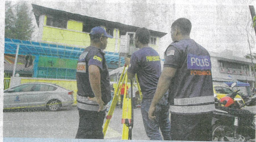
PEGAWAI forensik melakukan pengimejan tiga dimensi bagi melengkapkan siasatan kes kebakaran Pusat Tahfiz Darul Quran Ittifaqiyah di Kampung Datuk Keramat, Kuala Lumpur, semalam.

“Petunjuk utama yang berjaya mengaitkan kes tersebut dengan perbuatan khianat dikesan hasil analisis ujian sampel oleh pegawai kimia