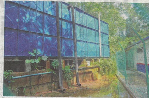
SEBUAH tangki air di bawah PPR Intan Baiduri turut berdepan masalah kebocoran.

bumbung rumah kami turut rosak apabila air yang meresap menyebabkan catnya mengelupas. Apa yang paling membimbangkan penduduk sekiranya berlaku lintas pintas pada