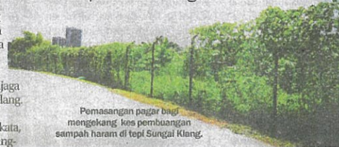
Pemasangan pagar besi mengekang lori pembuangan sampah haram di tepi Sungai Klang.

Menurutnya, aktiviti terbaru adalah program melontar bebola enzim yang