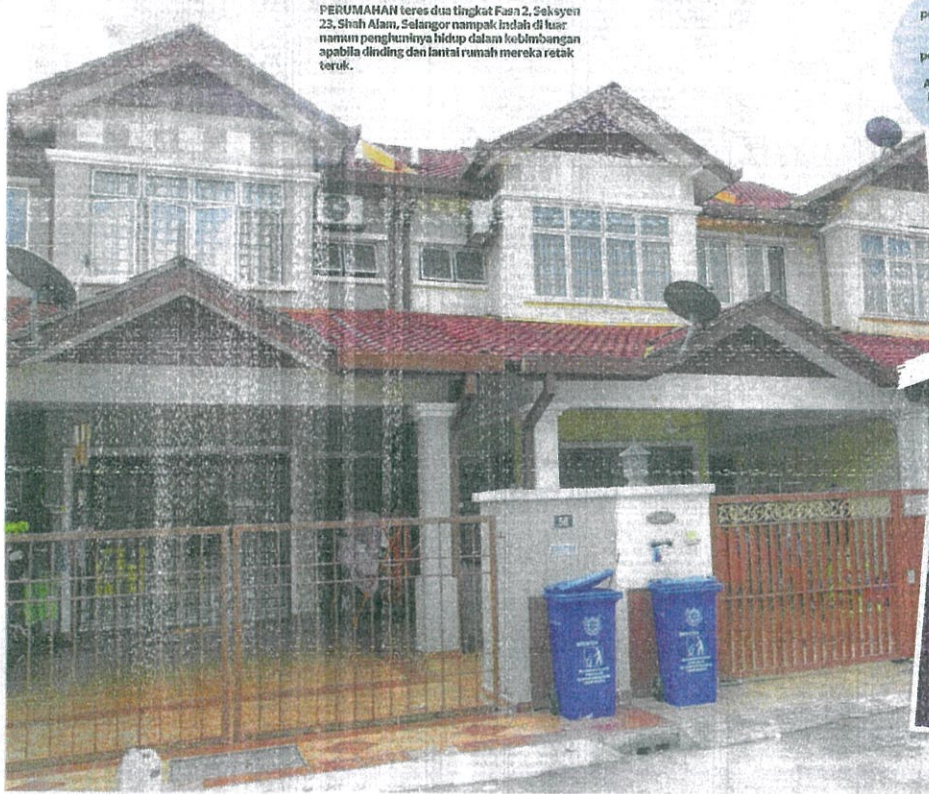
PERUMAHAN teres dua tingkat Fasa 2, Seksyen 23, Shah Alam, Selangor nampak indah di luar namun penghuninya hidup dalam kebimbangan apabila dinding dan lantai rumah mereka retak teruk.