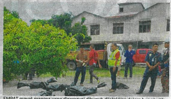
EMPAT mayat mangsa yang dipercayai dibunuh diletakkan dalam beg plastik hitam selepas rumah didiami mereka musnah dalam kebakaran di Jalan Tepi Laut, Tanjung Sepat semalam.