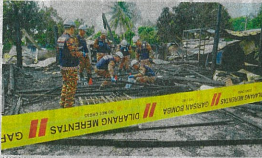
ANGGOTA bomba melakukan siasatan di lokasi kebakaran yang meragut nyawa dua warga emas dan dua kanak-kanak di sebuah rumah di Jalan Tepi Laut, Tanjung Sepat.

“Tiga mayat yang ditemui mempunyai kesan ketakutan dan