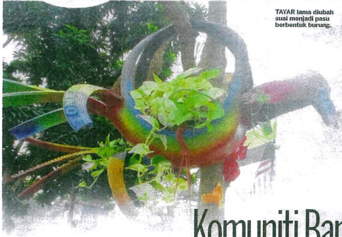
TAYAR lama diubah suai menjadi pasu berbentuk burung.