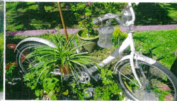
BASIKAL terpakai masih boleh digunakan sebagai bahan hiasan meletakkan pokok.