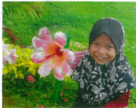
KAWASAN yang bersih dan cantik bukan sahaja dapat menceriakan penempatan tetapi mengatakkan penyakit berbahaya seperti denggi.