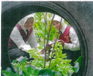
PELAJAR SK Bandar Behrang 2020 tidak ketinggalan menyertai pertandingan gotong-royong anjuran penduduk Bandar Behrang, Tanjung Malim, Perak.

K IRA-KIRA 200 orang penduduk komuniti Bandar Behrang 2020, Tanjung Malim, Perak mengambil bahagian dalam program gotong-royong membersihkan kawasan setempat mereka sejak awal tahun ini.