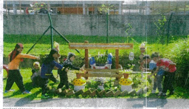
KANAK-KANAK menunjukkan tanda bagus selepas selesai menghias kawasan mereka.