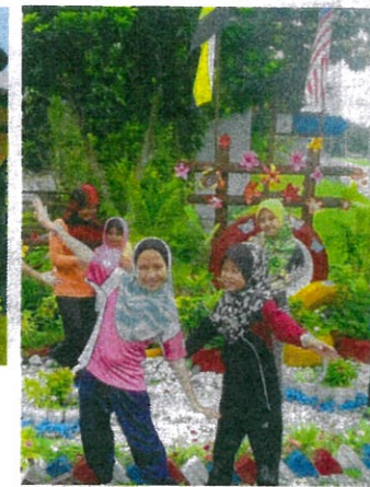
KANAK-KANAK ini tidak kisah mengorbankan hari minggu mereka dengan menghias kawasan penempatan supaya lebih bersih dan ceria.

sukarela dalam aktiviti gotong-royong. Pada penilaian akhir pertandingan berkenaan, johan telah dimenangi Zon Teratai, Zon Melati (naib johan) dan Zon Orkid (tempat ketiga). Mereka menerima plak, duit serta hamper.