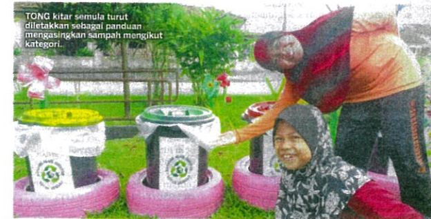
TONG kitar semula turut diletakkan sebagai panduan mengasingkan sampah mengikut kategori.