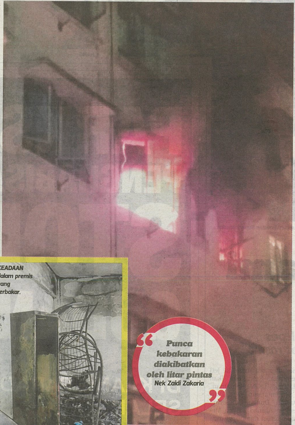
KEADAAN dalam premis yang terbakar.