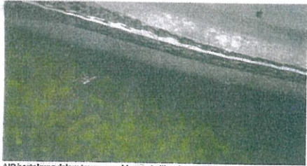
AIR bertakung dalam tayar mungkin menjadikan kawasan ini lokasi 'penternakan' nyamuk terbesar di Selangor.

teliti seterusnya tindakan penguatkuasaan akan diambil bersama beberapa agensi yang terlibat," katanya kepada Utusan Malaysia di sini hari ini. Beliau mengulas aduan yang dibangkitkan oleh Gagasan Prihatin Semenyih (GPS) baru-baru bersama penduduk kluatir longgokan tayar yang terletak di bawah kabel bervoltan tinggi akan mendatangkan kemudaratan sekiranya berlaku kebakaran. Menurut Kamarul Izan, penglibatan beberapa pihak berkepentingan juga diperlukan sekiranya operasi penguatkuasaan diambil di tapak tersebut jika benar wujudnya ketidakpatuhan syarat PBT.