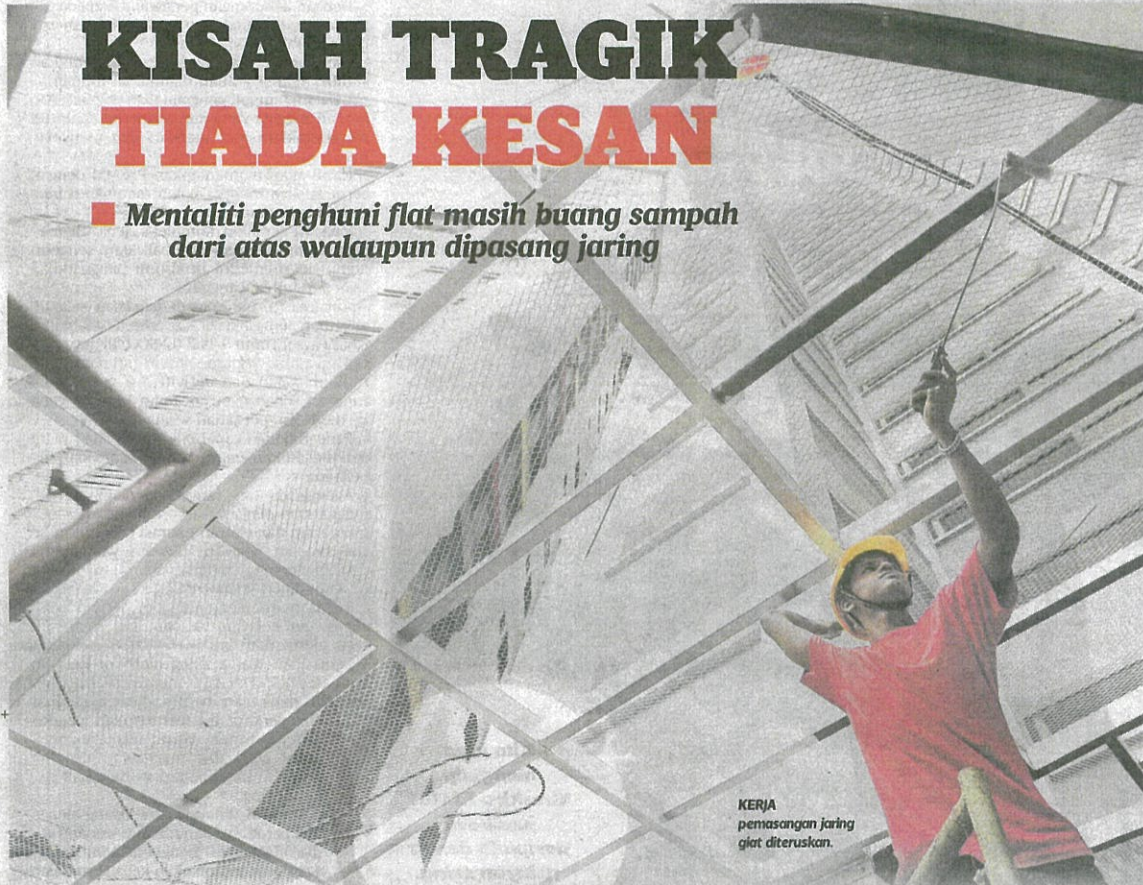
KERJA pemasangan jaring giat diteruskan.

■ Mentaliti penghuni flat masih buang sampah dari atas walaupun dipasang jaring