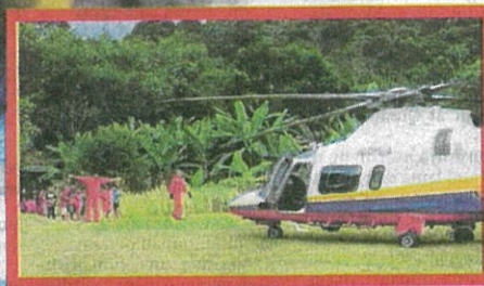
HELIKOPTER Agusta A109E Unit Udara JBPM membatalkan penerbangan ihsan kerana pesakit melahirkan anak lebih awal.