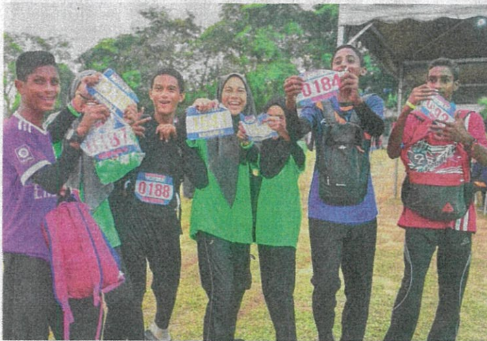
SEBAHAGIAN daripada pelajar yang menyertai acara larian yang bermula di pekarangan SK Bandar Baru Sungai Buloh, baru-baru ini.