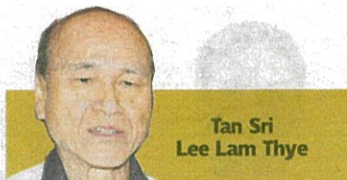
Tan Sri Lee Lam Thye