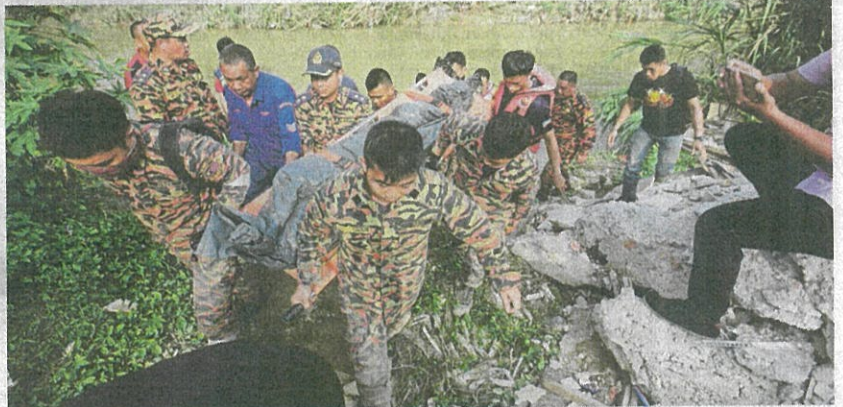
Anggota Bomba dan Penyelamat membawa mayat mangsa lemas yang terakhir, semalam.