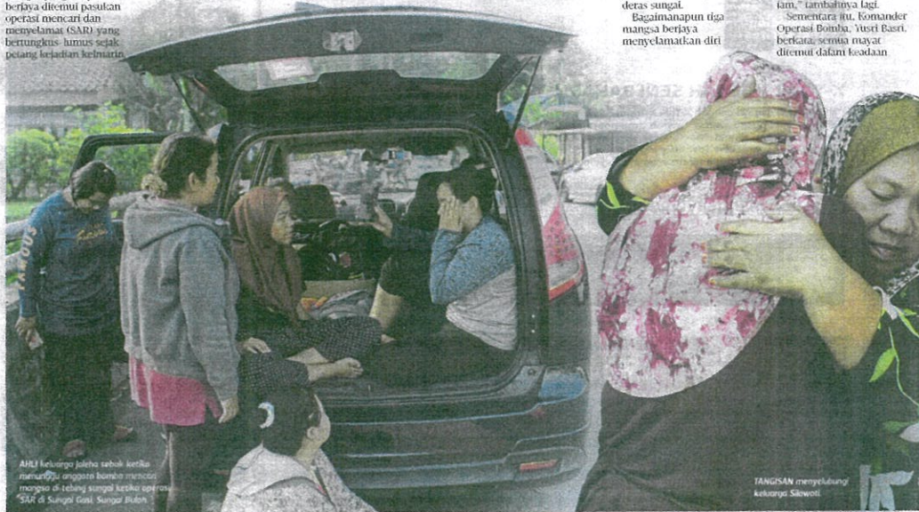
AHLI kesatuan jelahe sebak ketika memandu anggotanya mencari mayat di tebing sungai kurka operasi SAR di Sungai Gasi, Sungai Buloh.