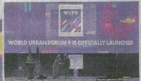
Lagu rasmi untuk WUF9 telah dicipta dan dipersembahkan oleh pelajar-pelajar Universiti Lim Kok Wing, merupakan Forum Dunia Sedunia pertama yang mempunyai lagu rasmi