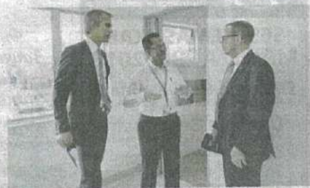
Delegasi USA dibawa ke sebuah unit kosong PPR Jinjang. Taklimat diberikan oleh YBhg. Datuk Sri Mohammad Bin Mentek, Ketua Setiausaha KPKT. Unit berkenaan berkeluasan 750 kaki persegi dengan 3 buah bilik. Delegasi juga dinikmati bawahan PPR Jinjang mempunyai sebanyak 2000 unit rumah.