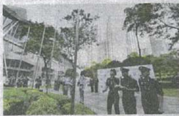
Upacara menaikkan bendera dan ucapan Perdana Menteri merasmikan WUF 2018

Objektif dan kaedah pelaksanaan WUF telah dimulakan semasa sesi pertama forum yang diadakan di Nairobi, Kenya, dari 29 April - 3 Mei 2002. Sesi kedua pula telah berlangsung di Barcelona, Sepanyol, 13-17 September 2004; ketiga di Vancouver, Kanada, 19-23 Jun 2006; sesi keempat di Nanjing, China, 3-6 November 2008; sesi kelima di Rio de Janeiro, Brazil, 22-26 Mac 2010; sesi keenam di Naples, Itali, 1-7 September 2012 dan sesi ketujuh di Medellin, Colombia, pada 5-11 April 2014.