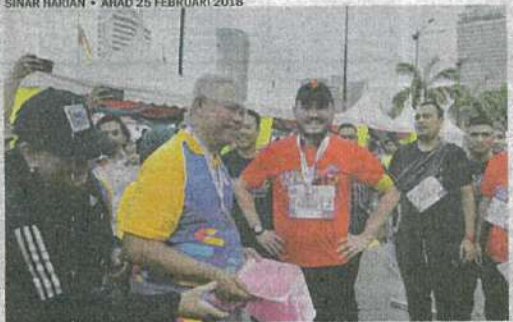
Raja Muda Selangor, Tengku Amir Shah (tengah) bersama Menteri KPKT, Tan Sri Noh Omar berkenan menyertai larian World Urban Run bersama Menteri KPKT, Tan Sri Noh Omar.