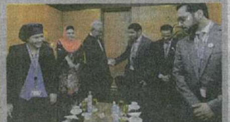
United Arab Emirates (Pesuruhjaya Kesatuan Eropah untuk Dasar Serantau) UAE Faleh Al Ahbabi Menteri dan Ketua Pengarah Majlis Perancangan Bandar, Abu Dhabi Emiriah Arab Bersatu (UAE)

Delegasi China mengucapkan tahniah dan memuji penganjuran WUF9 yang teratur dan penglibatan peserta yang ramai ke WUF9 di Kuala Lumpur. Kementerian Perumahan China berharap agar lebih banyak kerjasama dapat dijalin antara Malaysia dan China dalam bidang teknologi pembinaan.