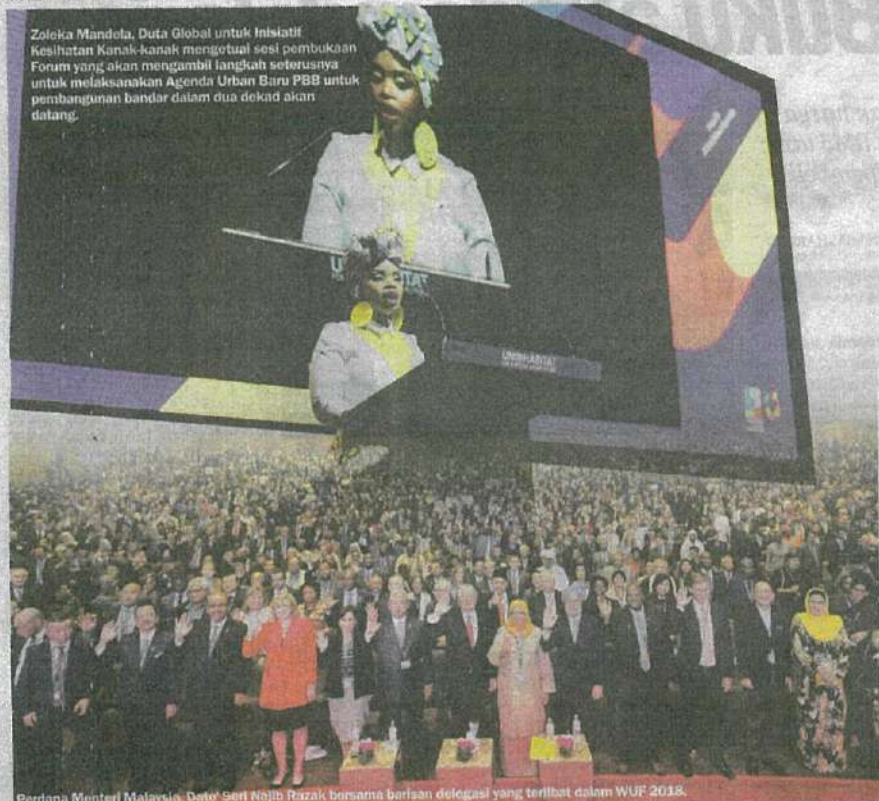
Perdana Menteri Malaysia, Datu' Seri Najib Razak bersama barisan delegasi yang terlibat dalam WUF 2018.