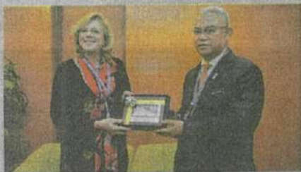
EU Ms. Corina Crețu (Pesuruhjaya Kesatuan Eropah untuk Dasar Serantau)

Ms. Corina Crețu, Pesuruhjaya Eropah bagi Polisi Setempat (Regional Policy) selaku wakil (EU) mengucapkan tahniah di atas kejayaan Malaysia selaku tuan rumah WUF9. Beliau mengagumi kepekaan pembangunan, kelendahan negara dan rakyat Malaysia yang ramah.