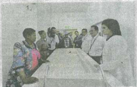
Delegasi Morocco, Afrika Selatan dan Kongo dibawa melawat surau, bilik pengurusan jenazah dan taman permainan PPR Sentul. Delegasi seterusnya dibawa ke sebuah unit kosong berkeluasan 750 kaki persegi dengan 3 buah bilik. Delegasi juga dibawa melawat kawasan sebagai kawasan tempat letak kereta bertingkat dan kawasan sekitar PPR Sentul. Delegasi dimaklumkan bahawa PPR Sentul ini mempunyai 500 unit kediaman.