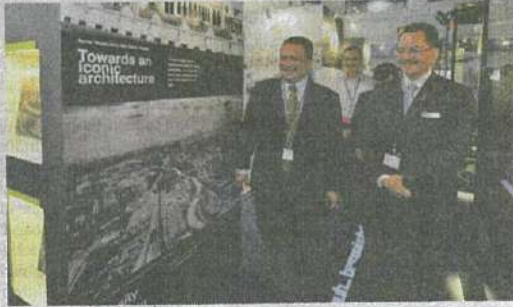
Raja Muda Perlis tertarik dengan projek-projek perumahan mampu milik yang disediakan oleh kerajaan Malaysia dan usaha kerajaan Malaysia dalam merancang pengurusan sisa pepejal yang sistematik dan teratur.