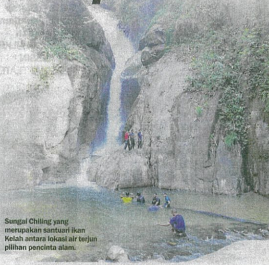
Sungai Chiling yang merupakan santuari ikan Kelah antara lokasi air terjun pilihan pencinta alam.

Beberapa aktiviti sukan lasak bertaraf antarabangsa dipromosikan dalam kempen Tahun Melawat Hulu