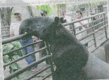
Tapir merupakan maskot Tahun Melawat Hulu Selangor 2007.

Kewujudan kunci air berusia lebih 100 tahun dipanggil Perigi Tujuh di Serendah antara khazanah tertua tinggalan zaman pentadbiran Inggeris, masih berfungsi sehingga sekarang.