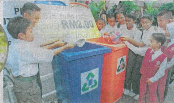
PELAJAR wajar diberi pendedahan mengenai program kitar semula. GAMBAR HIASAN

Lautan yang tidak ada sempadan dan boleh dibawa arus ke seluruh dunia.