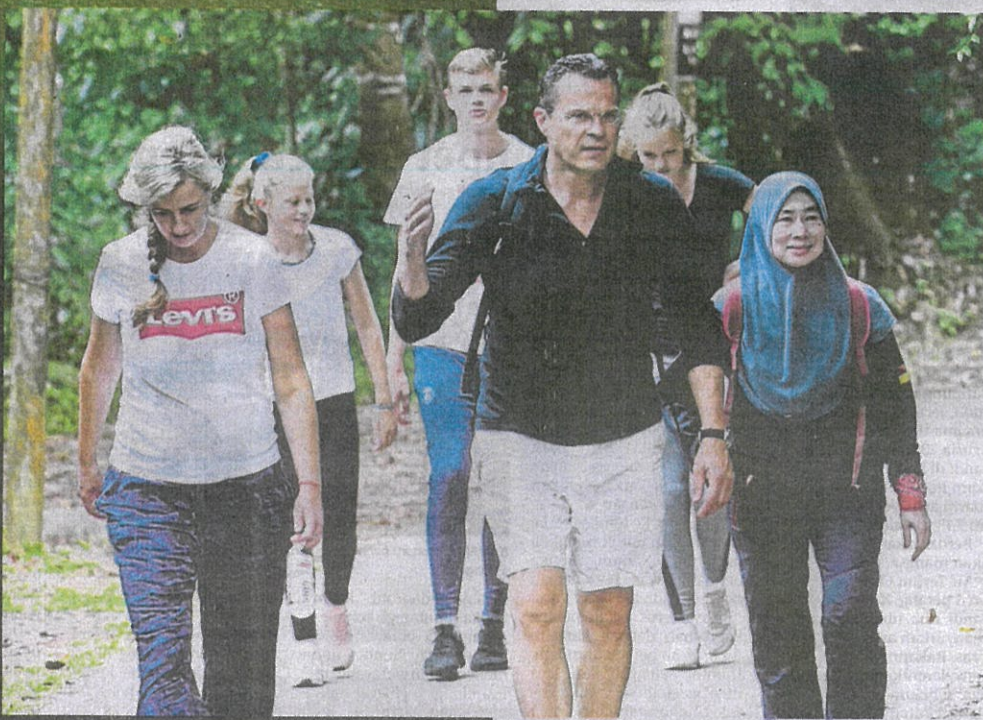
keluarga mangsa berjalan menghala ke arah Gunung Berembun sambil ditemani wanita tempatan bagi mencari mangsa yang kehilangannya masuk hari keempat, semalam.