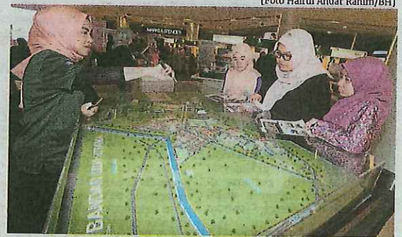
Antara pengunjung yang hadir pada Pameran Hartanah MyRumah 2019 di Komtar JBCC, Johor Bahru, semalam.

Siri ketiga pameran hartanah MyRumah Komtar JBCC itu akan berlangsung bermula jam 10 pagi hingga jam 10 malam disertai oleh