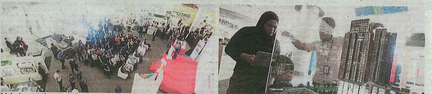
Sebahagian pengunjung yang hadir pada Majlis Pelancaran Pameran Hartanah MyRumah 2019 di Komtar JBCC, Johor Bahru, semalam.