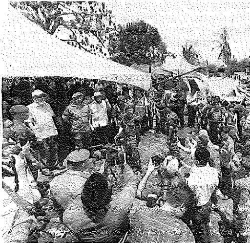
AL-SULTAN ABDULLAH (empat dari kiri) melawat lokasi kebakaran di Kampung Otentik, Tanjung Batu Keramat, Tawau semalam.

TAWAU - Yang di-Pertuan Agong Al-Sultan Abdullah Ri'ayatuddin Al-Mustafa Billah Shah berkenan mencemar duli menziarah mangsa kebakaran Kampung Otentik, Tanjung Batu Keramat dekat sini semalam bagi memenuhi hasrat baginda untuk bersama rakyat yang ditimpa musibah.