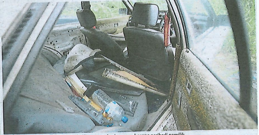
Antara kenderaan terbiar yang dijadikan stor penyimpanan barang peribadi pemilik.