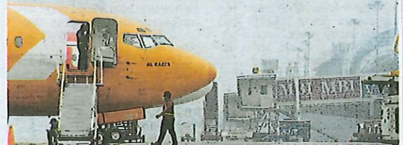
Keadaan jerebu di Lapangan Terbang Antarabangsa Pulau Pinang Bayan Lepas pada jam 1 petang semalam dengan bacaan IPU sangat tidak sihat.