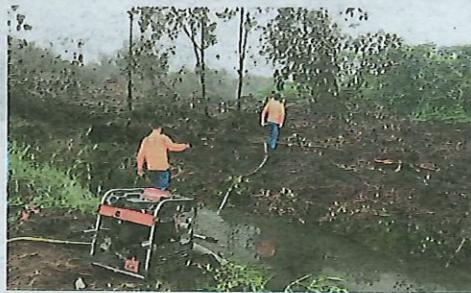
ANGGOTA APM menarik hos meredah belukar.