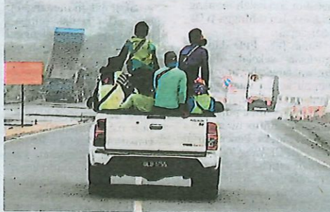
JARAK penglihatan yang terhad akibat asap kebakaran.