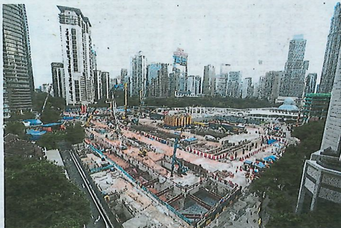
PEMBINAAN perumahan di titik stesen prasarana memudahkan mobiliti rakyat.