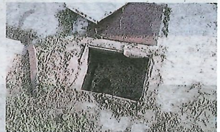
Dalam lubang kumbahan inilah mangsa ditemui mati lemas.

Sementara itu, Ketua Operasi dari Balai Bomba