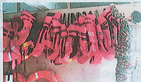
ANGGOTA bomba melakukan pemeriksaan dan ujian peralatan ke atas aset jabatan sebagai persiapan menghadapi banjir di Kota Kinabalu.