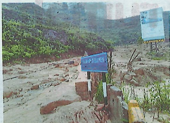
Tanah runtuh di Genting Highlands menyebabkan kakitangan dan penghuni sebuah hotel serta pangsapuri servis terkandas.