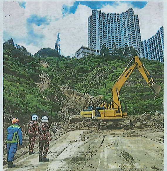
Anggota penyelamat memantau kerja pembersihan tanah runtuh di Genting Highlands, semalam.

"Berdasarkan siasatan dan pemeriksaan dijalankan, laluan di situ pada masa ini selamat untuk digunakan," katanya.