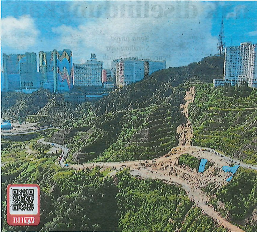
Keadaan lokasi tanah runtuh akibat hujan lebat di Jalan Ion Delemen, Genting Highlands, semalam.