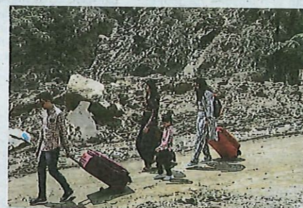
Pengunjung pusat peranginan tanah tinggi terkenal itu terpaksa berjalan kaki melintasi kawasan kejadian tanah runtuh di Jalan Genting-Amber Court ketika tinjauan media semalam.

"Setakat ini, mereka terpaksa jalan kaki ekoran keadaan laluan yang masih belum selamat untuk dibuka kepada kenderaan," katanya.