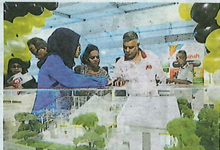
PENGUNJUNG mendengar penerangan daripada kakitangan LPHP pada Pameran Hartanah MyRumah Perak-Ku@PIEX 2019.

Menurutnya, antara pakej menarik disediakan di gerai