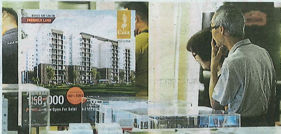
PENGUNJUNG meneliti maklumat kediaman di Pameran Hartanah MyRumah Perak-Ku@PIEX 2019 di Stadium Indera Mulia.

Tawaran babit lokasi di Ipoh, Lembah Meru dan Ulu Kinta