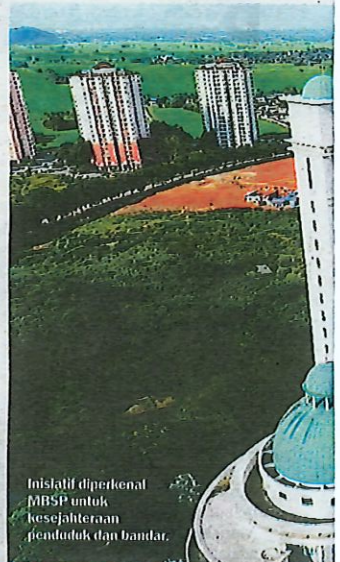
Inisiatif diperkenal MBSP untuk kesejahteraan penduduk dan bandar.

Peranan yang perlu dimainkan oleh semua warga MBSB adalah memastikan perkhidmatan dapat