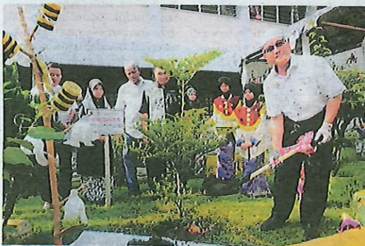
MBSP komited menanam pokok bagi merealisasikan Seberang Perai sebagai bandar raya karbon neutral.

Saya memahami sasaran yang ditetapkan adalah tinggi untuk dicapai. Bagaimanapun, demi kesejahteraan rakyat, seluruh warga kerja MBSP berjanji memastikan sasaran tersebut dicapai dan menjadikannya satu kontrak sosial yang akan dilaksanakan