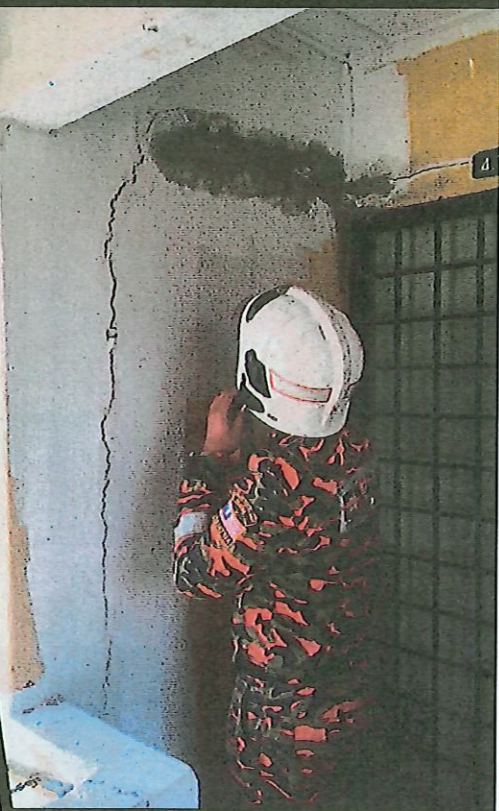
ANGGOTA bomba memeriksa retakan pangsapuri.