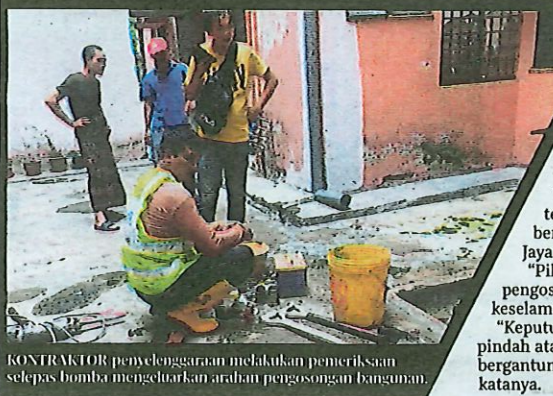
KONTRAKTOR penyelenggaraan melakukan pemeriksaan selepas bomba mengeluarkan arahan pengosongan bangunan.