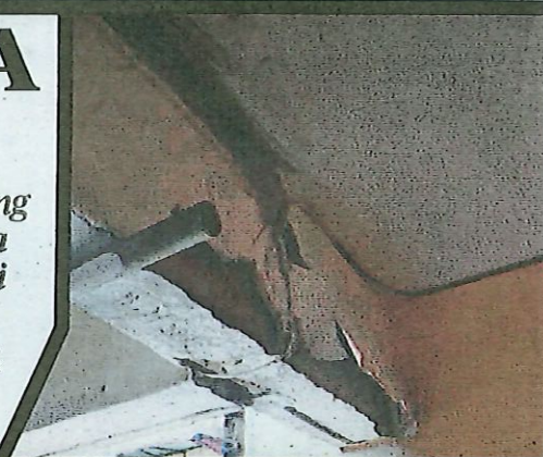
PENGHUNI Pangsapuri Taman Keramat Permai Ampang bimbang keretakan semakin serius.