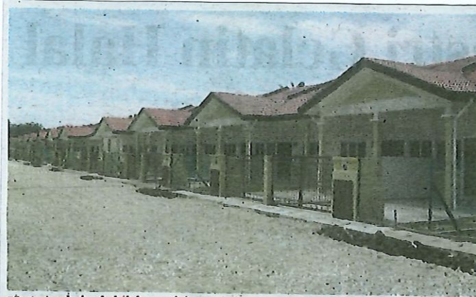
75 peratus daripada kelulusan pinjaman baharu adalah pembelian bagi hartanah jenis kediaman. (Foto hiasan)