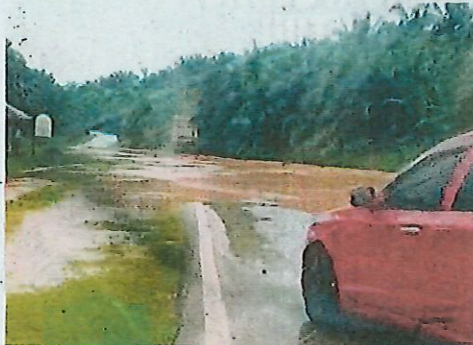
LALUAN Batu 17 Jalan Kluang ke Kahang berhampiran Ladang Pemprosesan Kelapa Sawit Pertubuhan Peladang Negeri Johor hanya boleh dilalui oleh kenderaan berat.

"Pengguna dilarang menghampiri aset dan pemasangan TNB seperti Tiang Elektrik TNB, Pencawang Elektrik TNB. "Jika terlihat wire dan pemasangan TNB terjatuh di lantai, sila hubungi TNB di talian 15454 dengan segera," katanya.