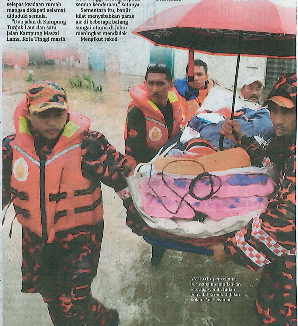
ANGGOTA penyelamat berusaha memindahkan seorang wanita hidup penyakit kronik di Jalan Rolan Air Segamat.