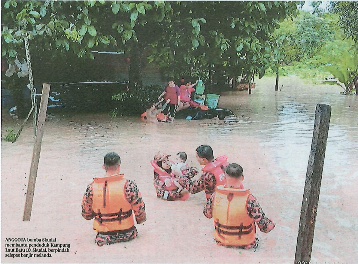
ANGGOTA bomba Skudai membantu penduduk Kampung Laut Batu 10, Skudai, berpindah selepas banjir melanda.