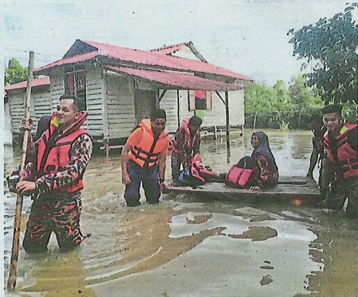
Anggota Angkatan Pertahanan Awam dan bomba memindahkan penduduk terjejas banjir di Kampung Parit Pechah, Muar.

731 penduduk ditempatkan di 11 pusat pemindahan tiga daerah