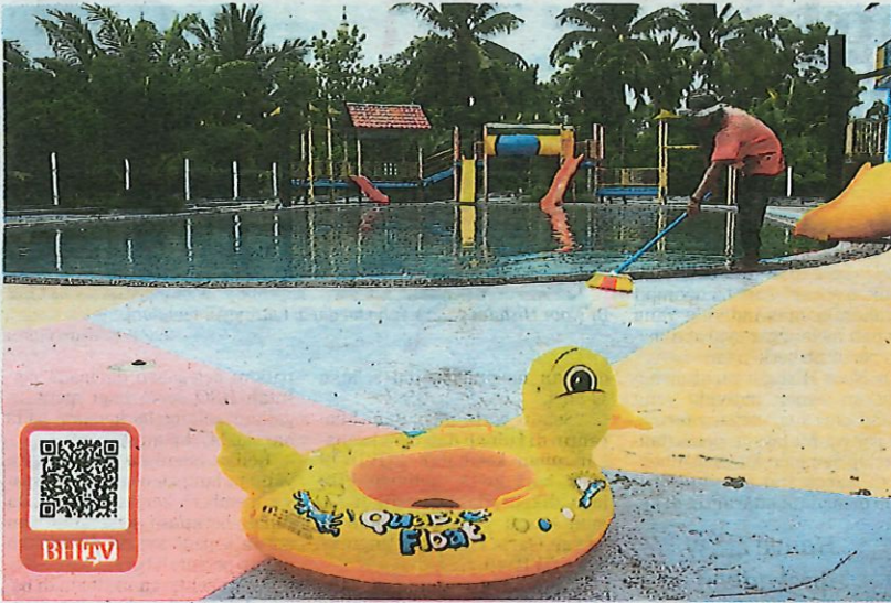
Pekerja membersihkan Taman Tema Air Mini Pok Nik di Kuantan, semalam.